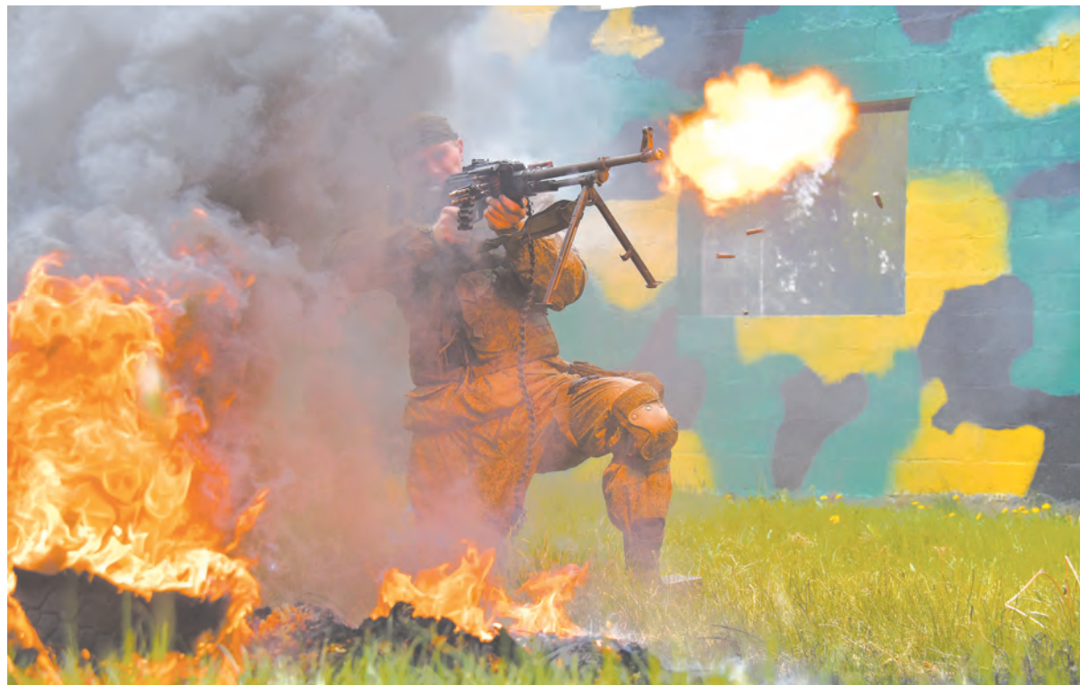
Ручной пулемёт «Печенег» в деле

Ещё больше военных новостей – по этому QR-коду