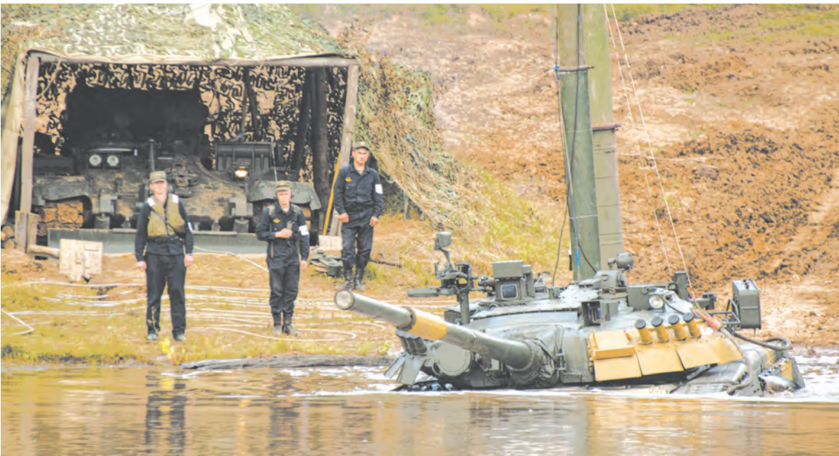
Учимся всему необходимому в бою

ведено около 50 командно-штабных и тактических (тактико-специальных, лётных, зачётных) учений и тренировок.