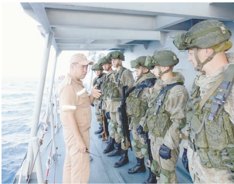
Инструктаж на борту СКР «Ярослав Мудрый» группы морских пехотинцев перед учением.

Виктор МАКСИМЕНКО, фото автора и из архива соединения.