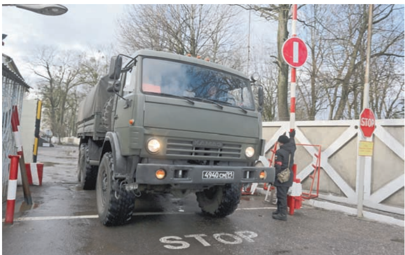
За КПП – на выполнение поставленных задач.