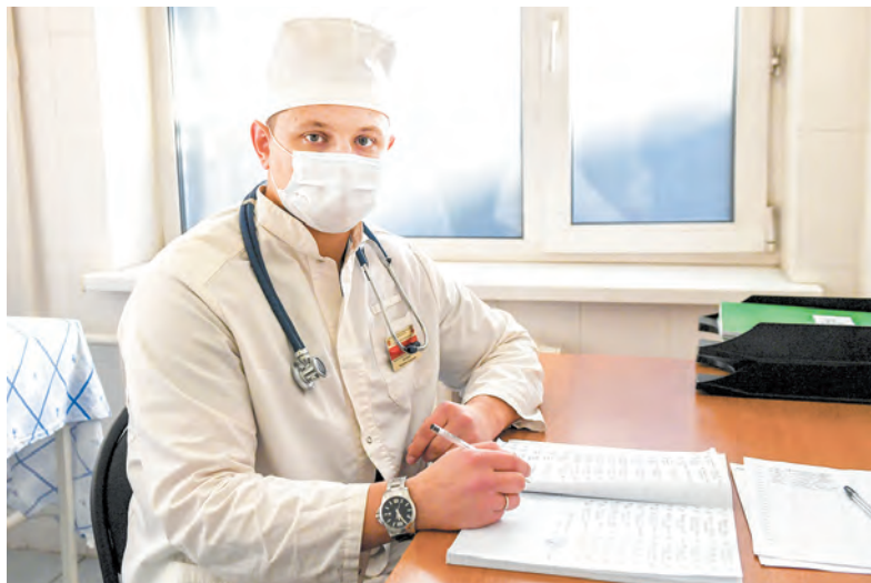
В первую очередь прививку сделали военным медикам

Также в пресс-службе округа рассказали, что военные врачи для выявления заражения вирусом COVID-19.