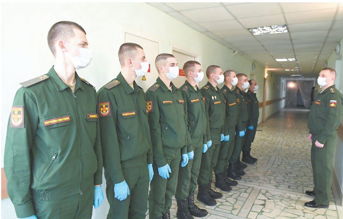
К вакцинации готовы