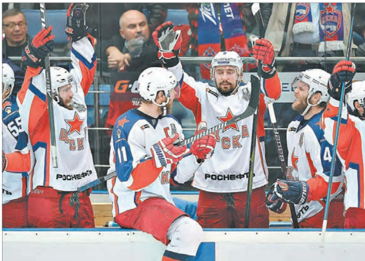
Вчера. Балашиха. «Авангард» - ЦСКА - 0:2. Радость армейцев после заброшенной шайбы.