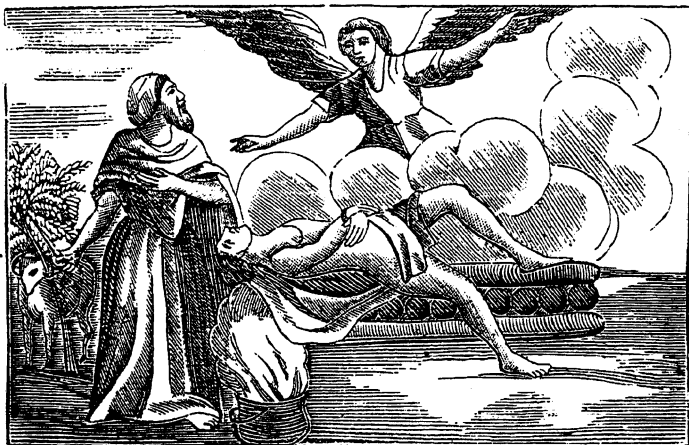
А. Авраамъ приносить сына на жертву Богу.