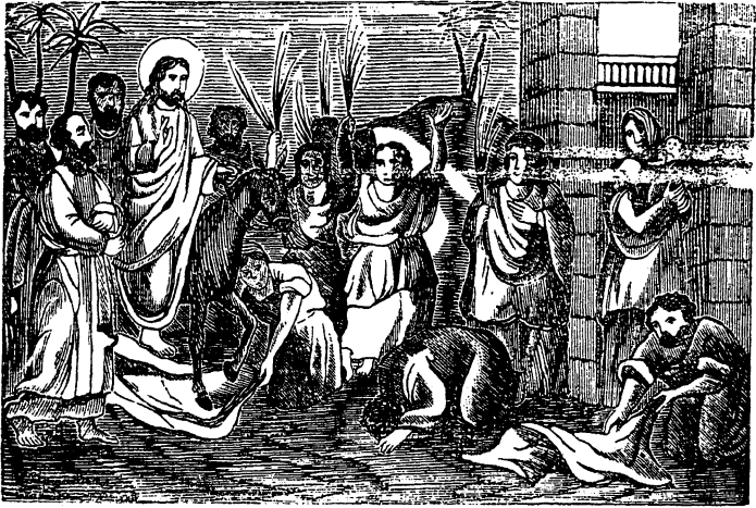
В. Входъ въ Іерусалимъ.