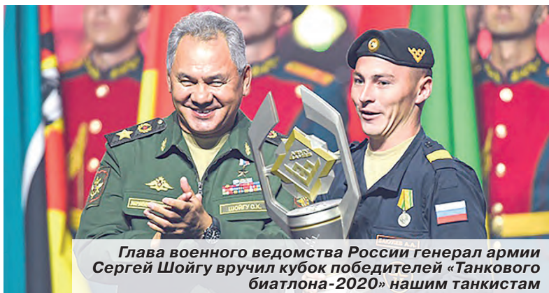
Глава военного ведомства России генерал армии Сергей Шойгу вручил кубок победителей «Танкового биатлона-2020» нашим танкистам

VI Армейские игры международные стали историей. Солдаты и офицеры в разных регионах России и ещё в четырёх странах показывали своё мастерство и самоотверженность. Наша сборная выступила более чем достойно, удержав общекомандное лидерство и в этом году.