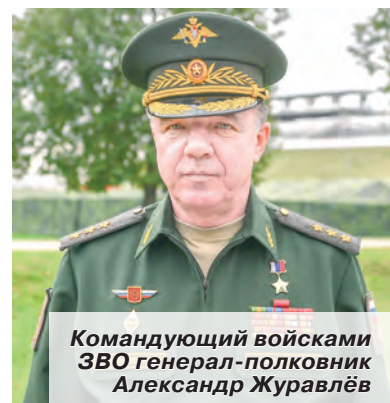
Командующий войсками ЗВО генерал-полковник Александр Журавлёв

– Пользуясь случаем, хочу поздравить наших танкистов с про-