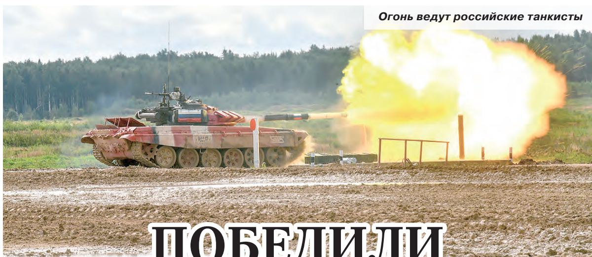
Огонь ведут российские танкисты