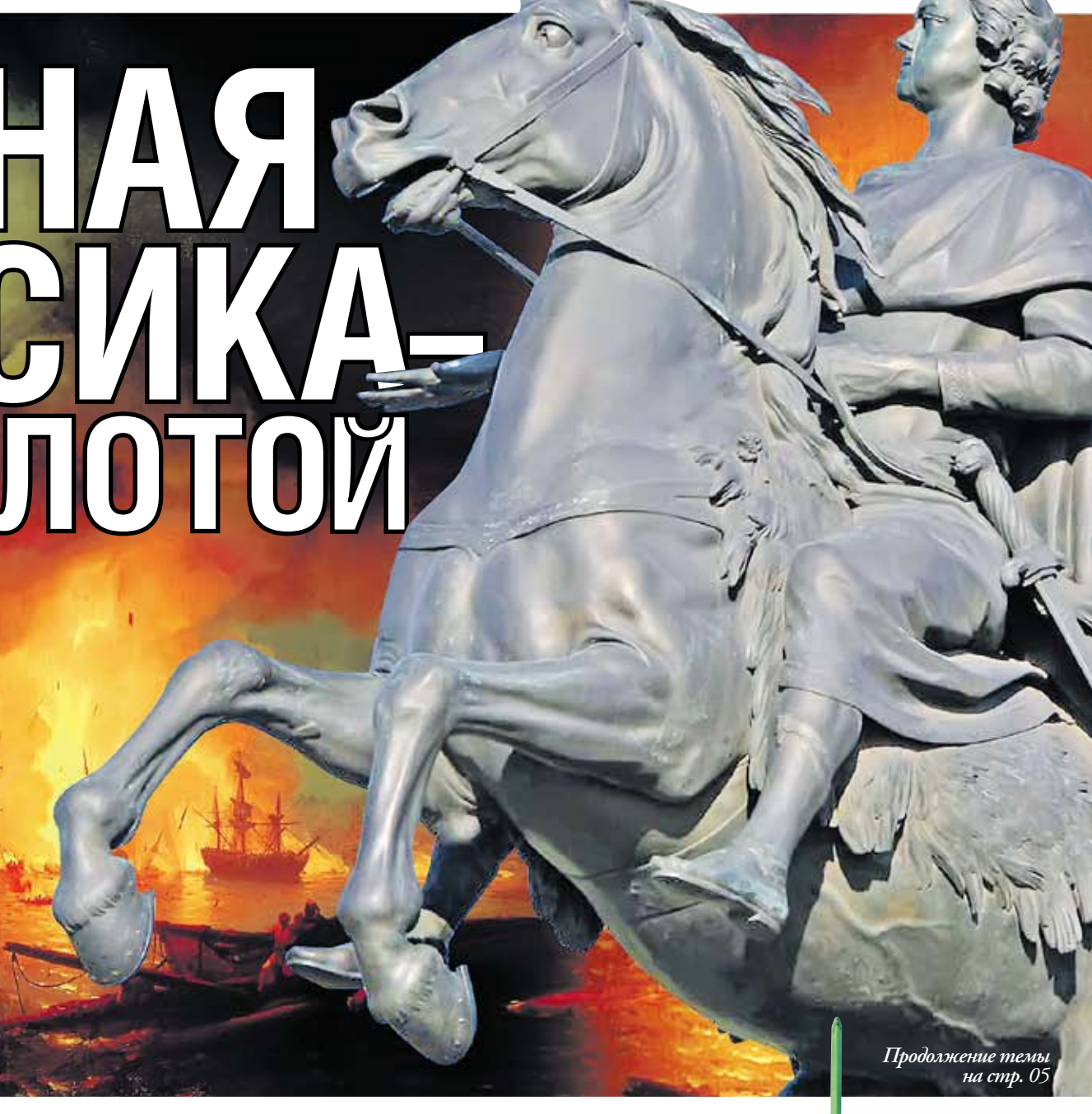
Продолжение темы на стр. 05