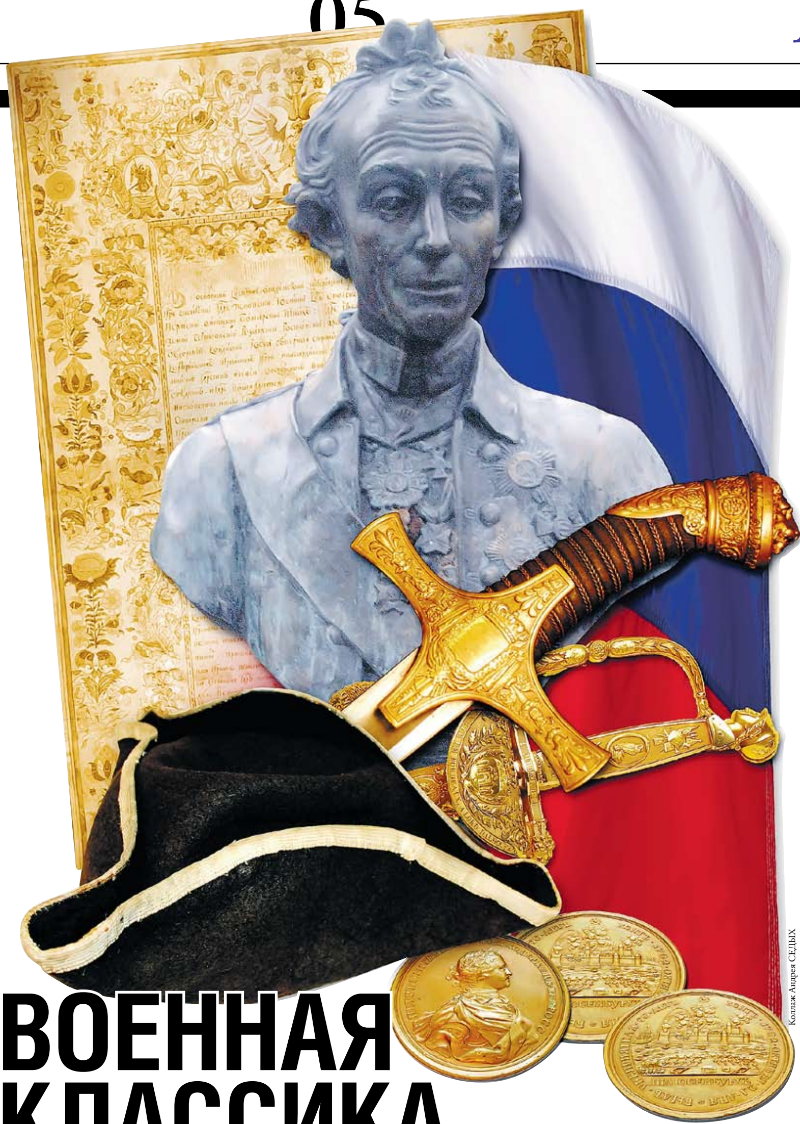
Коллаж Андрей СЕДУХ

Все есть в нашей классическом наследии: авторитетные имена, научность, привлекательность, идейная сила и глубина, высокий нравственный заряд, блеск и выразительность мысли, злободневность, блестящий и понятный русский язык. Даже элементарное знакомство с ней способно вдохновить, подвигнуть к мысли и действию, пробудить национальную гордость, патристические чувства, любовь к военному делу, стремление к самосовершенствованию. Приведем лишь некоторые примеры.