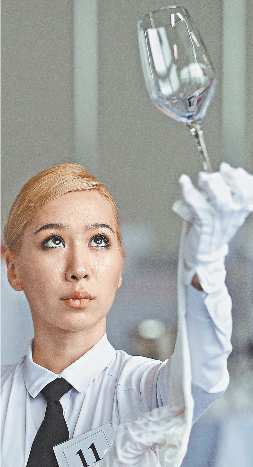
К онлайн-торговле алкоголем допускают только проверенных продавцов.

Прслеживаемость каждой бутылки достигла такого уровня, что, например, мы можем увидеть, какая алкогольная продукция была в бутылке с защитной смесью, которую использовали в нападении на военкомат. По марке можно выявить, где и во сколько эта продукция куплена. Правоохранительные органы приходят в конкретный магазин, запрашивают камеру видеозаписи под конкретное время. На кассе видно, кто покупает этот алкоголь.