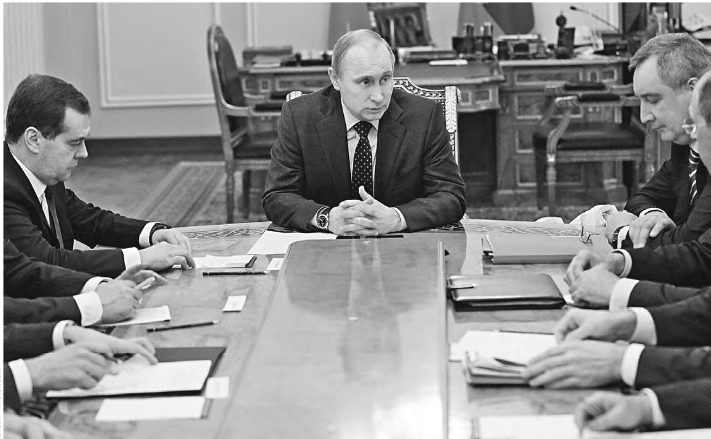
Владимир Путин надеется, что ситуация на Украине изменится к лучшему.