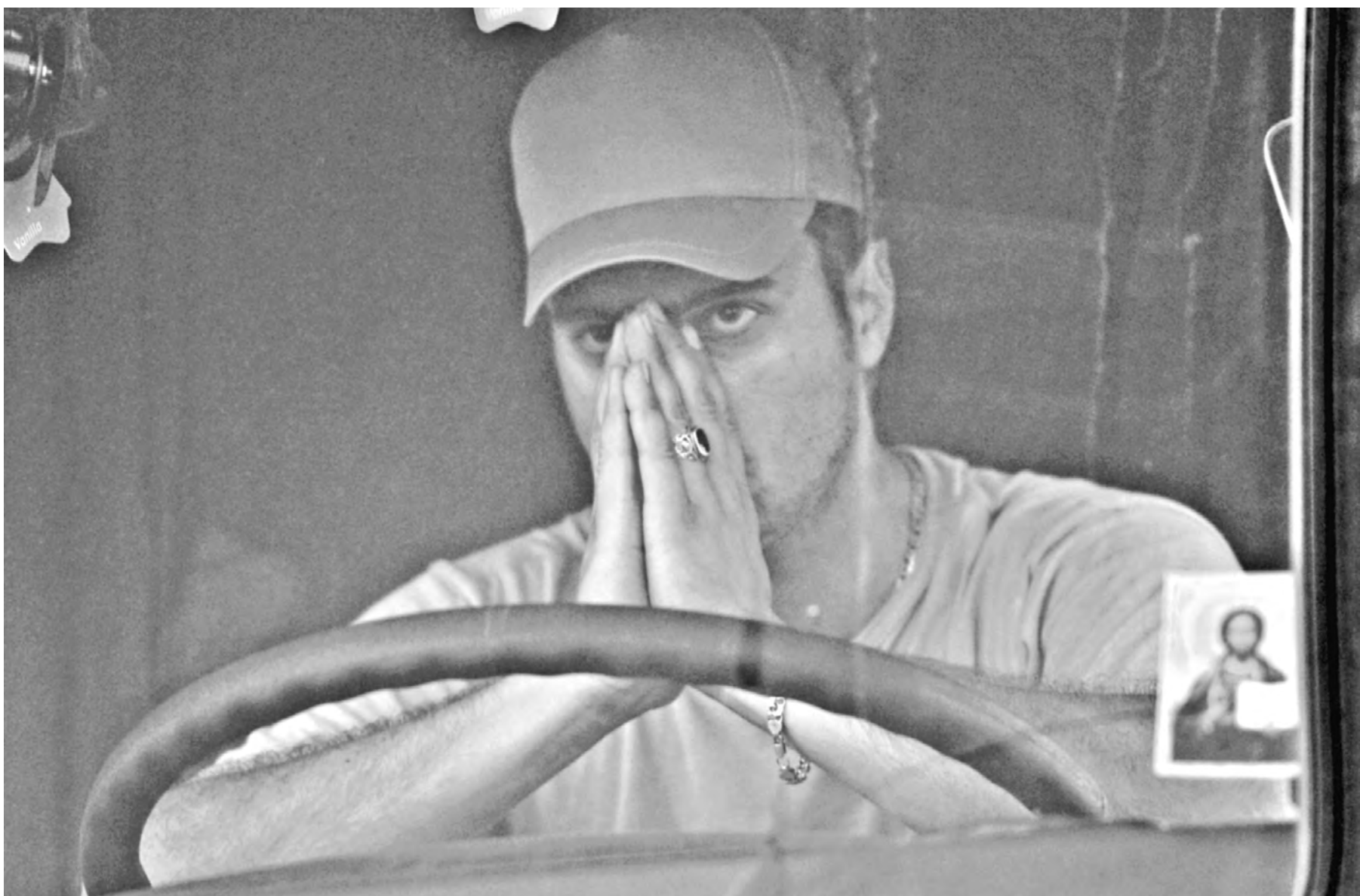
Гуманитарный конвой вернулся без потерь.