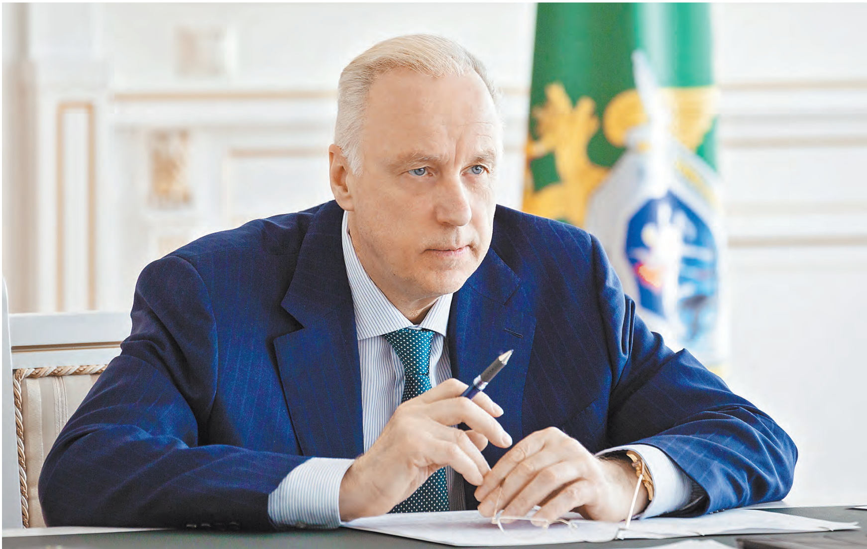
ПРЕСС-СЛУЖБА ОБЩЕСТВЕННОГО КОМИТЕТА РФ