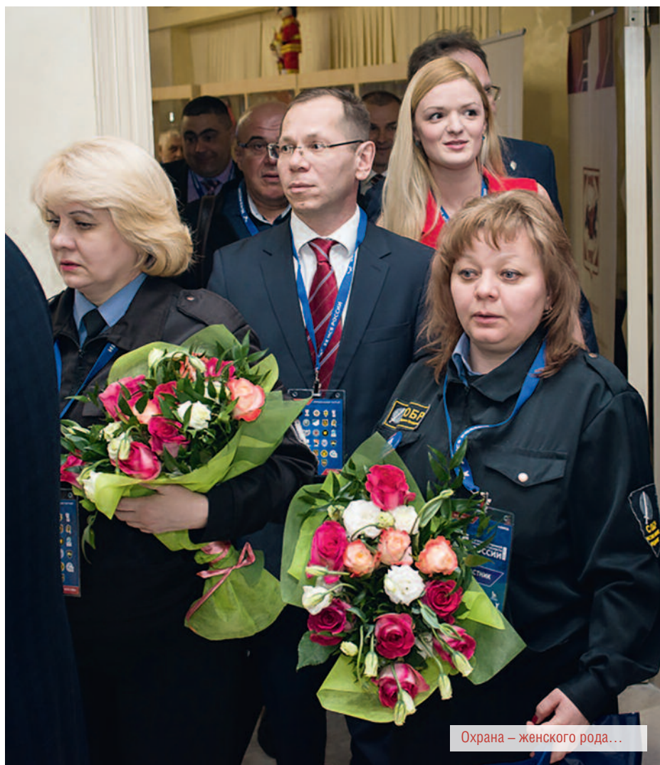
Охрана – женского рода...

Мнение авторов может не совпадать с мнением редакции. Перепечатка материалов журнала допускается по согласованию с редакцией. Ссылка на журнал обязательна. За тексты рекламных объявлений редакция ответственности не несет. Рукописи не рецензируются и не возвращаются.