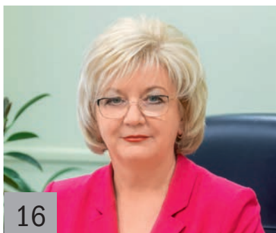
16 | В. Н. АРТАМОНОВА , заместитель губернатора Вологодской области, начальник департамента финансов