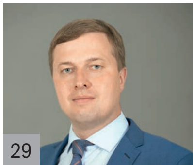
29 | С. В. БОЧАРОВ , директор Департамента государственного управления и государственной службы Нижегородской области