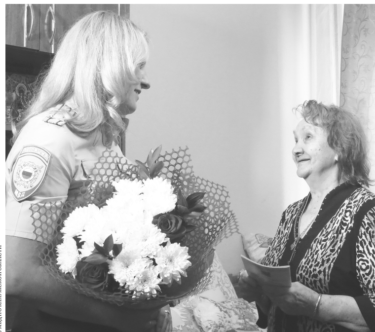
УМВД КАЛУЖСКОЙ ОБЛАСТИ