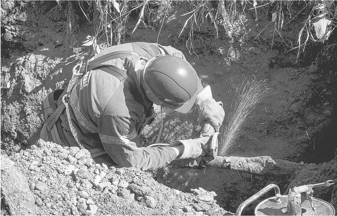
АДМИНИСТРАЦИЯ ГОРОДА ТУЛА

Под Тулой реконструировали газопровод, чтобы предотвратить ЧП