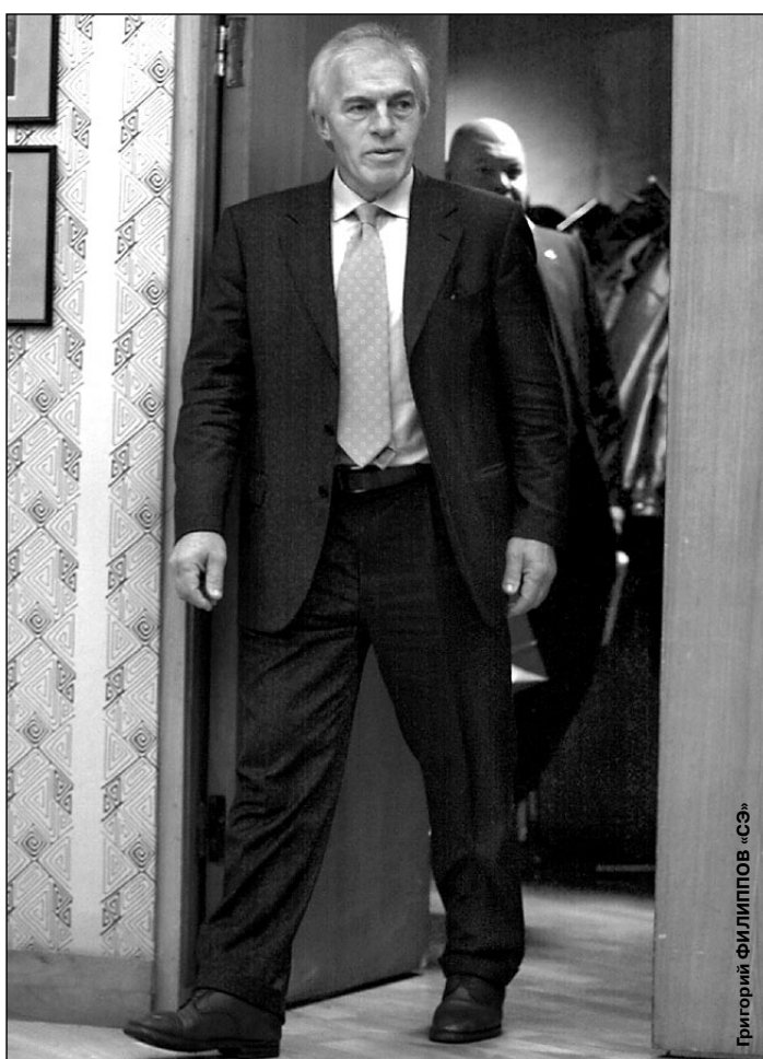
5 декабря 2003 года. Первое появление Невии СКАЛЫ перед российскими журналистами.

1. Основная проблема российских и украинских футболистов, как мне представляется, - психологического характера. Большинство из них зачастую довольствуется малым. Моя задача - привнести в команду желание побеждать и не останавливаться на достигнутом.