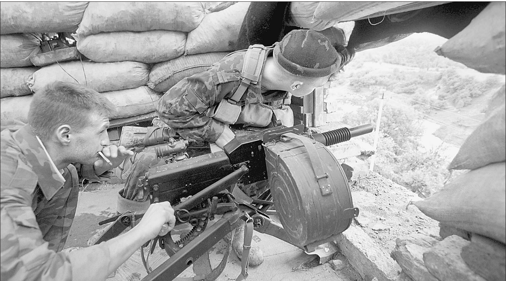
Погранзастава на Итум-Кале (граница России и Грузии)