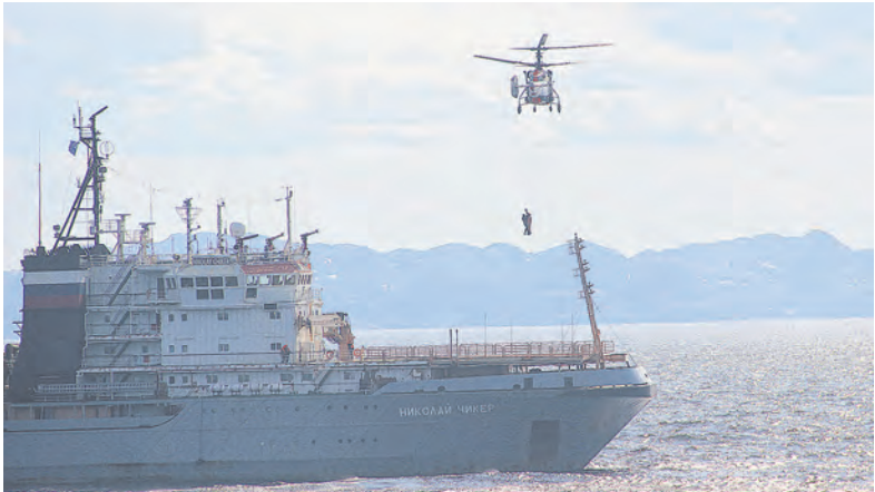
Доставка пострадавшего на борт СБС «Николай Чикер».

Североморцы продемонстрировали мощь флота