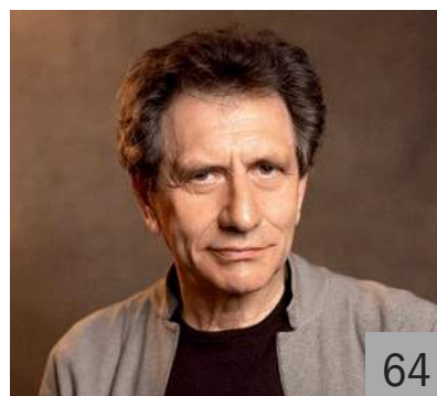
Е. В. КНЯЗЕВ, народный артист РФ, актер театра и кино