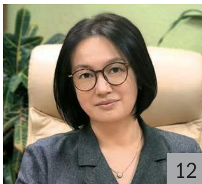
Д. Л. САМАНДАС, министр финансов Магаданской области