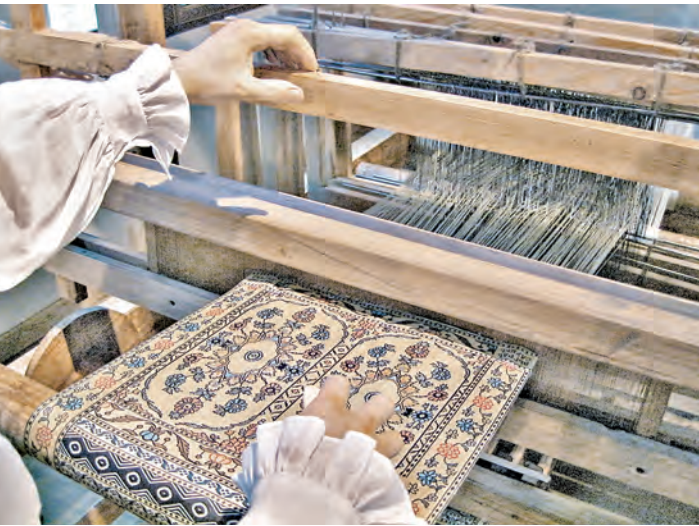
Случкий пояс стал одним из национальных символов Беларуси.

эта деталь мужского костюма была настолько яркой и неповторимой, что со временем пояс стал одним из национальных символов страны. Он был воспет классиком белорусской литературы Максимом Богдановичем в стихотворении «Случские ткачихи». Оригинальные изделия в Беларуси хранятся в считанных экземплярах. Это раритет. Более