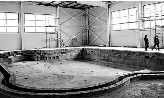
ПРЕСС-СЛУЖБА АДМИНИСТРАЦИИ ПЕРМИ

Чаши бассейнов уже готовы, началась внутренняя отделка зданий.