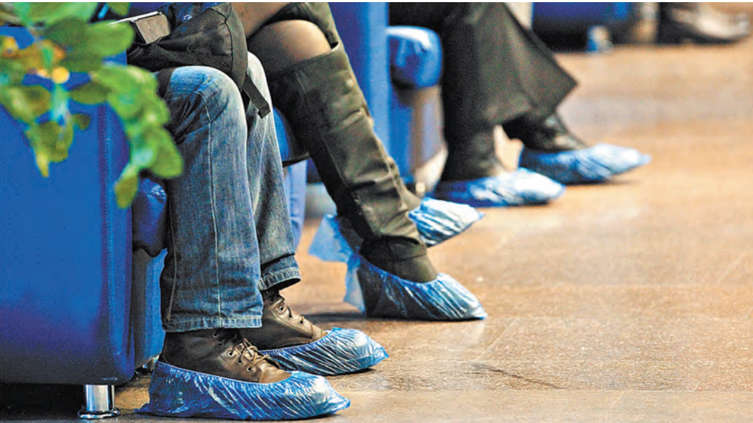
Россиян приучили надевать бахилы в поликлиниках и больницах, но до полного соблюдения санитарных норм в медицинских учреждениях пока далеко.

ли используется офисная, сами медики не проходят медосмотры, не сдают анализы и не делают прививки, нет схем обращения с медицинскими отходами. Выявляются и случаи несоблюдения норм здорового питания, то есть больничная еда оказывается слишком однообразной и не питательной, особенно для ослабленных болезнью людей. Встречаются и более серьезные нарушения. Например, обеззараживание одноразовых медицинских изделий (шприцев, резиновых перчаток) проводится при неполном погружении в раствор дезсредства, не проводится камерная деобработка постельных принадлежностей (матрацев, подушек, одеял) после выписки стационарных больных, на упаковках с простерилизованными медицинскими не указаны сроки их хранения.