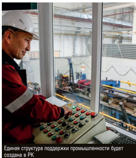
Единая структура поддержки промышленности будет создана в РК

Государственные институты развития будут объединены в единую структуру для поддержки отечественной промышленности. Теперь в нее входят Казахстанский институт развития индустрии (КИРИ) и два нацгентства — по технологическому развитию (НАТР) и по развитию местного содержания (NadLoC). По словам министра индустрии и инфраструктурного развития Романа Скляра , реструктуризация позволит «институционально поддерживать наших производителей». Ранее эти организации предоставляли инновационные гранты, которые возмещали часть затрат на качество товаров и экспорт. Вероятно, объединенная структура займется разработкой новых механизмов поддержки отечественных производителей, в частности субъектов малого и среднего предпринимательства.