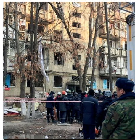
Взрыв газа разрушил три этажа дома в Таразе

27 февраля в многоэтажке Тараза из-за неосторожного обращения с газовым оборудованием произошел взрыв, в результате которого обрушились первые три этажа. По последним данным, пострадали шесть человек, из них трое погибли. Жители дома заявляют, что не вернутся в квартиры даже после капремонта. Эксперты до сих пор не дали ответа, пригоден