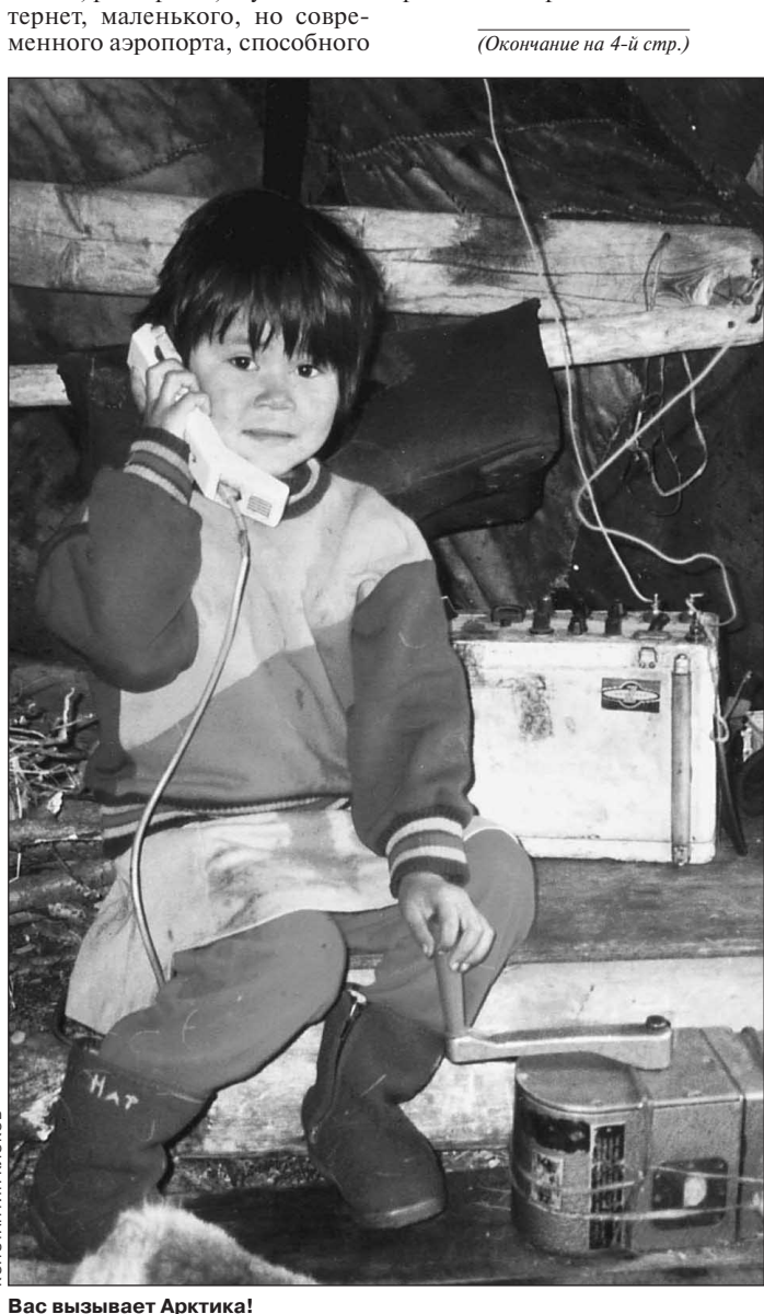
Вас вызывает Арктика!

— Очень сильно! Открытия же были сделаны достаточно давно!