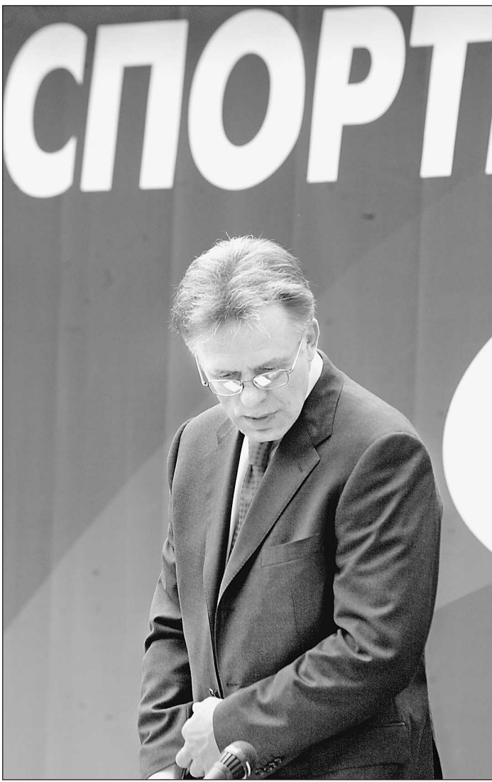
О, Спорт — ты...