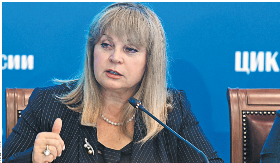
Злата Памфилова охарактеризовала эти выборы как высоконкурентные.

К 16.00 по московскому времени стало ясно: избиратели проявили интерес к этим выборам — явка в регионах не отставала от показателей прежних кампаний, а в некоторых — даже превысила процент прошлых выборов.