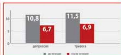
Рис. 3. Оценка показателей психосоматических расстройств у пациентов с сексуальными дисфункциями