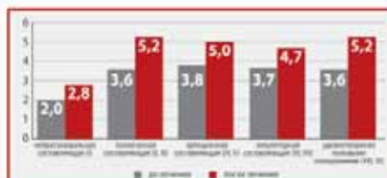
Рис. 2. Оценка структурных показателей сексуальной функции