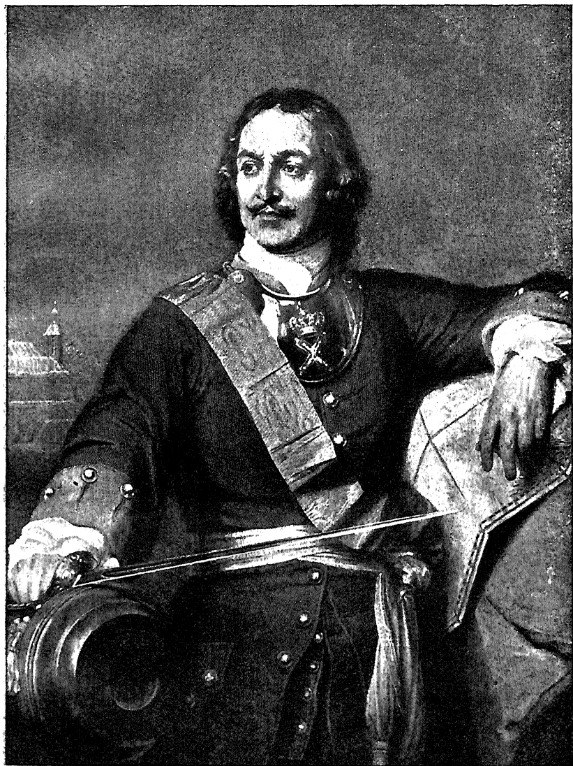
Императоръ Петръ I.