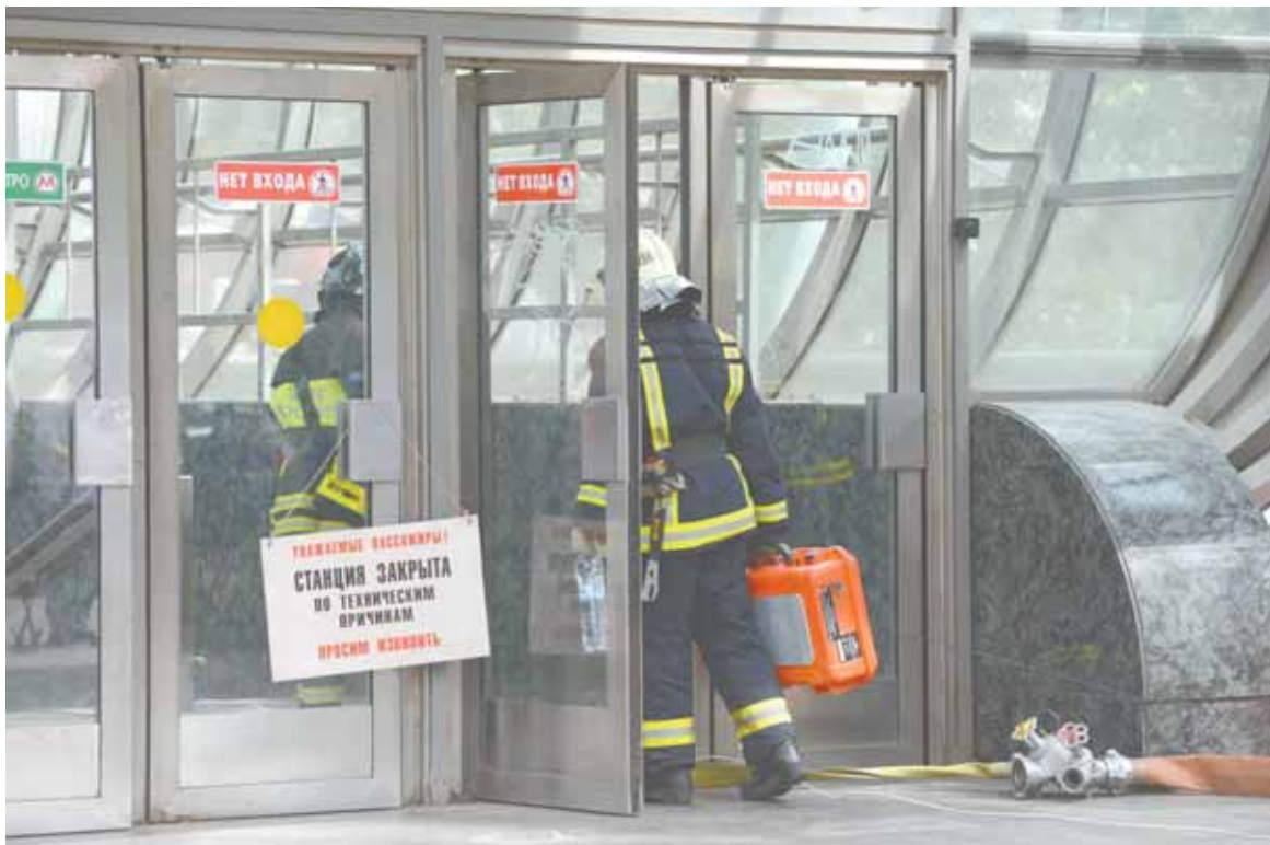
Спасатели Центра по проведению спасательных операций особого риска «Лидер» рассказали о ликвидации последствий аварии в московском метрополитене.

Продолжение работ по ликвидации последствий аварии.