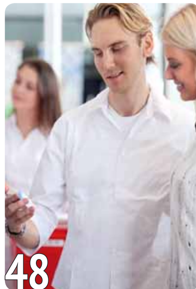
Как завоевать доверие покупателя?