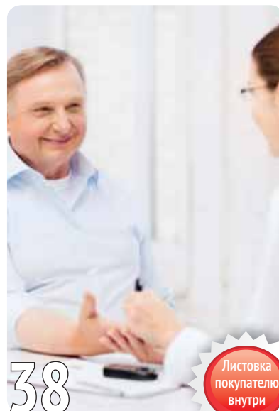
Памятка больному сахарным диабетом