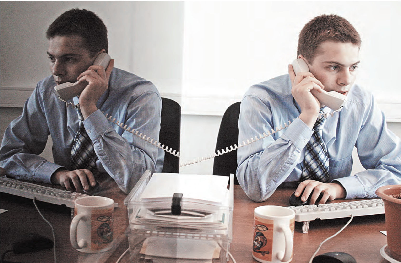
В Союзном государстве в самом разгаре работа уже над третьей по счету программой комплексной защиты информации.

Главная тема / В Пскове состоялась конференция по комплексной защите информации Союзного государства