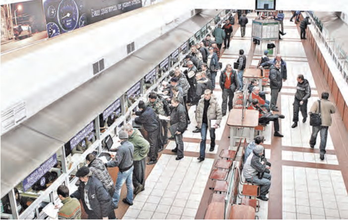
Грузовой переход «Козловичи» работает по европейским стандартам.

Сокращение продолжительности таможенных операций на границе, увеличение пропускной способности и обустройство инфраструктуры — эти задачи сегодня ставит перед собой Государственный таможенный комитет Беларуси.