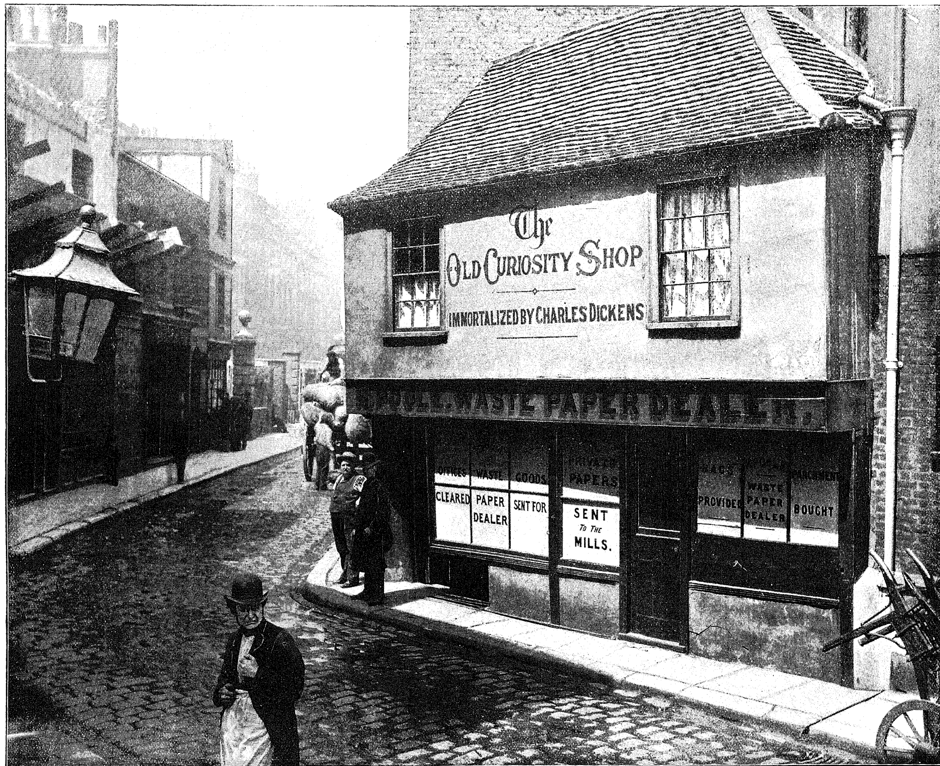
UN VIEUX MAGASIN DE CURIOSITÉS. LONDRES. — Charles Dickens a donné aux Anglais, par ses contes, une multitude de vrais amis. Les héros des récits de la plupart des autres nouvellistes nous amusent, nous instruisent ou nous distraient; mais ils tombent rapidement dans l'oubli, comme des connaissances de hasard. Pour le lecteur enthousiaste de Dickens, ses personnages semblent n'être pas fictifs, mais réels. On rit avec eux, on pleure avec eux, on aime leurs vertus, on oublie leurs faiblesses, de telle sorte que l'on conclut pour ainsi dire avec eux un pacte d'amitié à vie. Mais ce n'est pas tout; les caractères peints par Dickens sont généralement liés à de certains endroits qu'il a choisis avec grand soin et décrits avec une étonnante fidélité. C'est, en fait, cette description vive et juste des personnes et des lieux qui fait que l'on éprouve un plaisir continu à suivre son œuvre à travers « la Capitale du Monde », qu'il a tant aimée. On a même publié dernièrement des livres-guides à l'aide desquels on peut dépenser plusieurs journées à parcourir Londres, sans parler de la campagne anglaise, remarquant toute espèce de places, de rues, de maisons, d'auberges et d'églises bizarres, comme par exemple l'étrange enseigne qui suggéra à Dickens l'idée d'écrire le Magasin de Curiosités du Petit Nello, la maison qu'habitait Monsieur Tulkinghorn, ou même la vieille porte du cimetière où repose la pauvre Madame Dedlock. Le touriste européen qui aime David Copperfield , la Petite Dorrit et l'immortel Monsieur Pickwick ne doit pas visiter l'Angleterre sans avoir en sa possession le Londres de Charles Dickens , ou A travers l'Angleterre avec Charles Dickens .