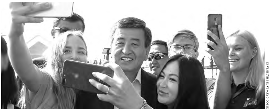
ПРЕСС-СЛУЖБА ПРЕЗИДЕНТА КР