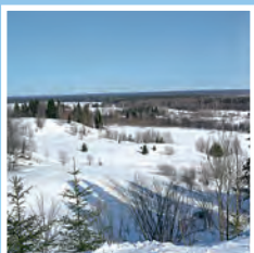
Чудо на семи холмах