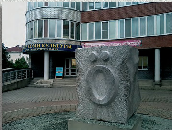
Памятник букве «ё» перед центром коми культуры в г. Сыктывкар