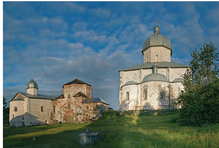
Крестовоздвиженский собор Кийского Крестного монастыря (слева – церковь Рождества Богородицы с колокольней и трапезной, XVII в.) на о. Кий.

Вторым каменным сооружением монастыря была церковь Происхождения Честных Древ Христовых, или Надкладезная (1660). Церковь маленькая, одноглавая,