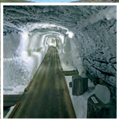
Под властью вечной мерзлоты