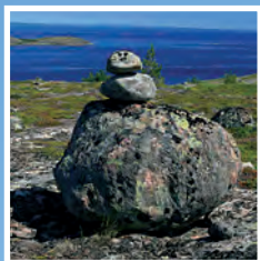
Загадки Немецкого Кузова