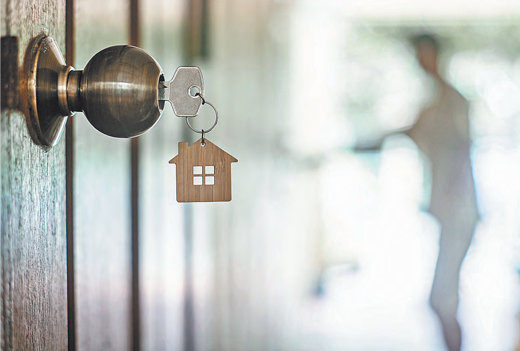
Последние сто лет Россия шла по пути уплотнения и централизации городов, пандемия коронавируса возродит концепцию распределения населения по средним и мелким городам.

Впрочем, в условиях пандемии коронавируса возможности госпрограммы ограничены. В начале апреля правительство подготовило пакет постановлений о корректировке отдельных госпрограмм. Увеличение финансирования подразумевается по тем из них, которые касаются поддержки отраслей, пострадавших от пандемии коронави