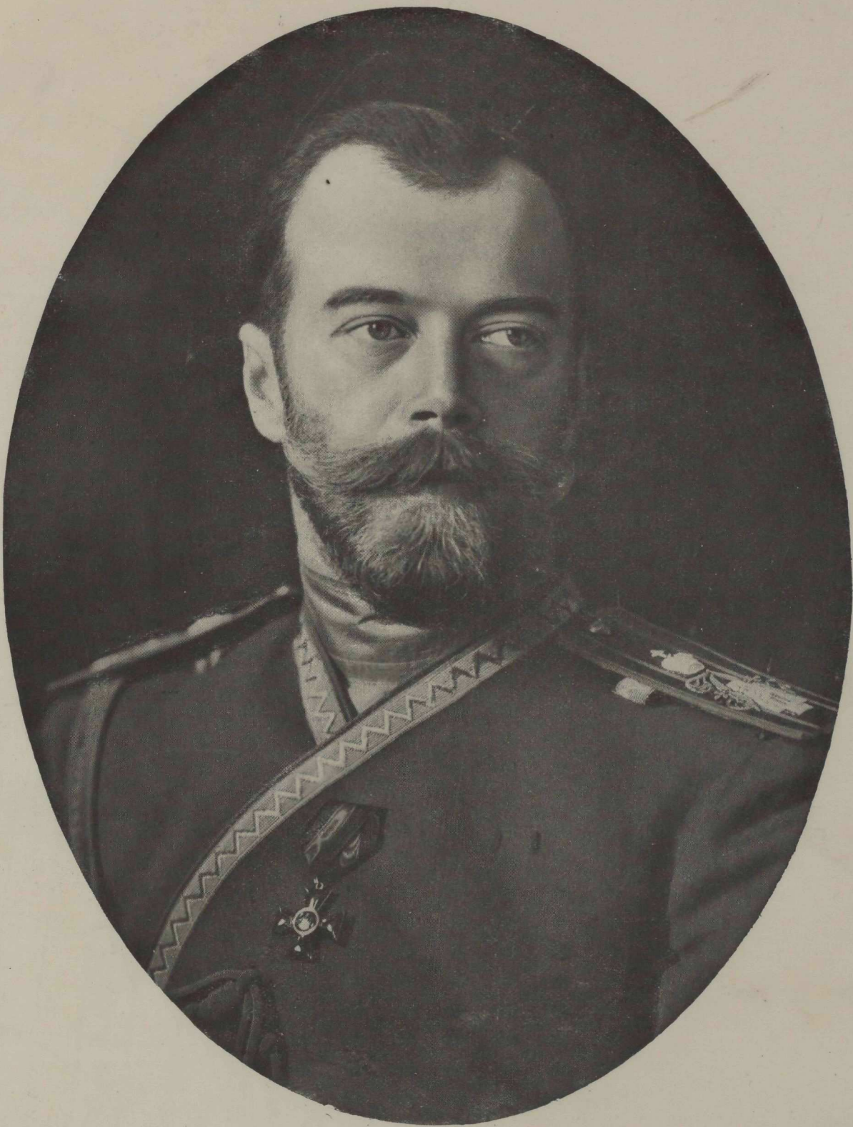
ЕГО ИМПЕРАТОРСКОЕ ВЕЛИЧЕСТВО ГОСУДАРЬ ИМПЕРАТОРЪ НИКОЛАЙ АЛЕКСАНДРОВИЧЪ.