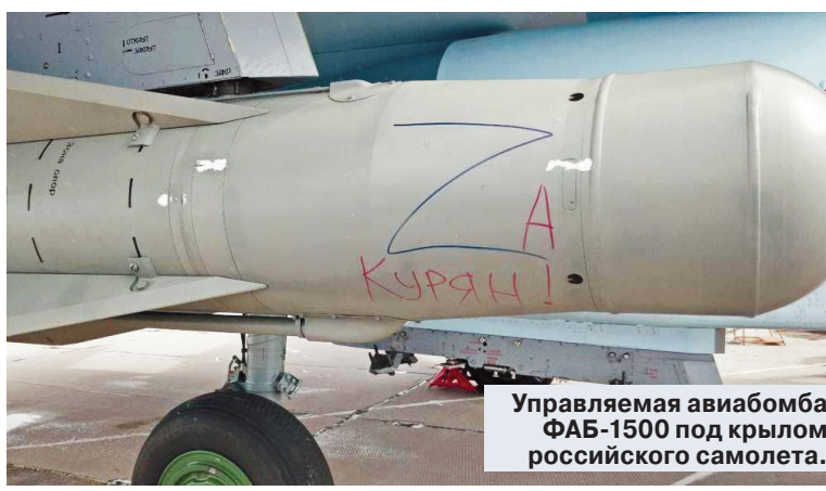
Управляемая авиабомба ФАБ-1500 под крылом российского самолета.