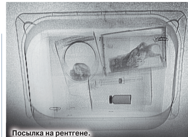
Посылка на рентгене.

Уже третью посылку с костями птицы из Крыма, отправителем которой числится итальянский актер и продюсер, умерший в 2006 году, получило французское посольство в Москве. В последнем отправлении предположительно были кости петуха — символа Франции. Как удалось выяснить «МК», 12 апреля около 18 часов водитель посольства Франции доставил смеждународного почтамта на Варшавском шоссе почтовые отправления, которые перед вскрытием с целью безопасности пропускаются через сканер. Одно из отправлений оказалось очень странным: сканер показал, что в белом пакете, обмотанном