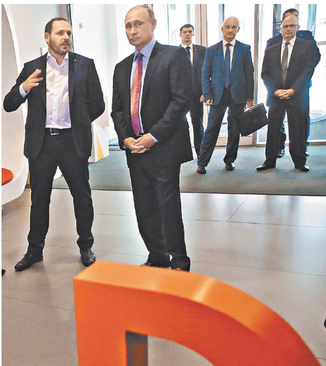
Глава государства посмотрел, чем живет российская IT-компания и оценил уникальные разработки.