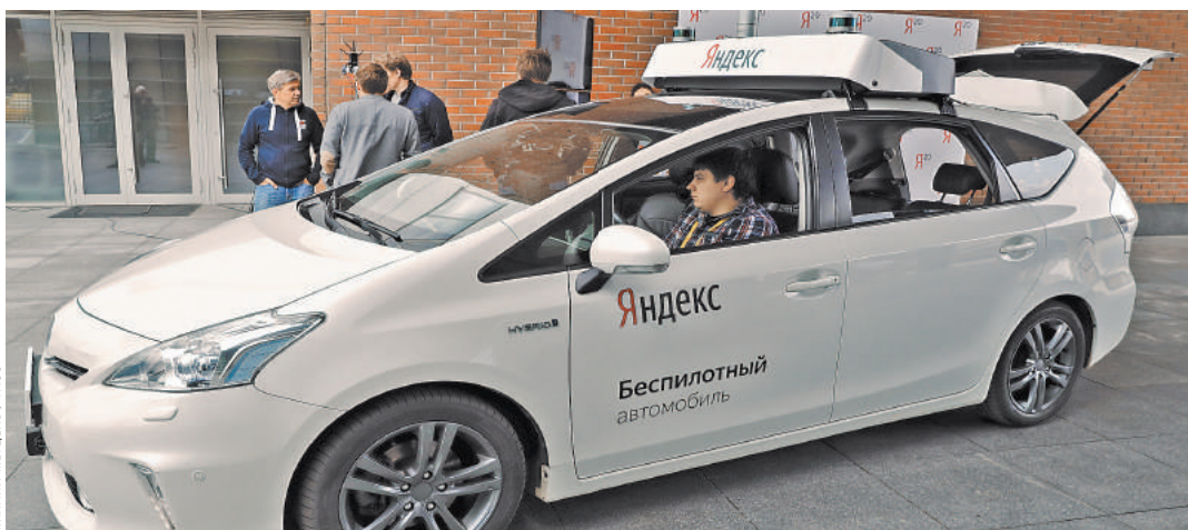
Одна из уникальных разработок «Яндекса» — беспилотный автомобиль.

ПРЯМАЯ РЕЧЬ Академик Давид Иоселиани: У кардиологов еще много нереализованных возможностей