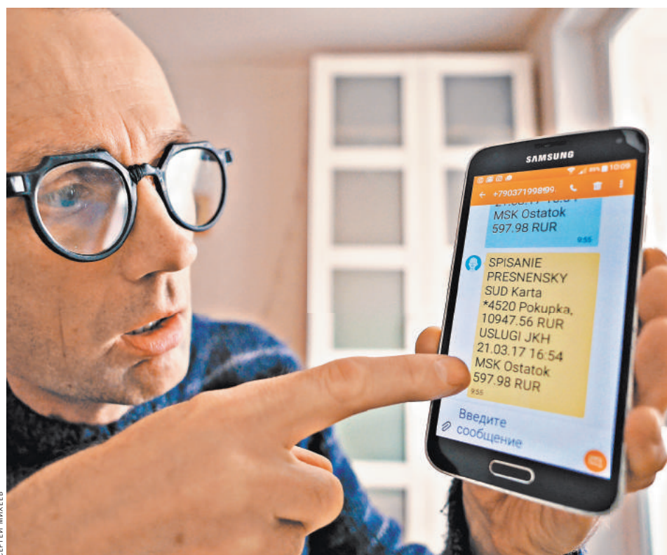
Приставы ежедневно направляют в банки около 3 миллионов запросов о счетах должников.

НАКАНУНЕ Избиратели Христианско-демократического союза проголосуют, посетив воскресную службу