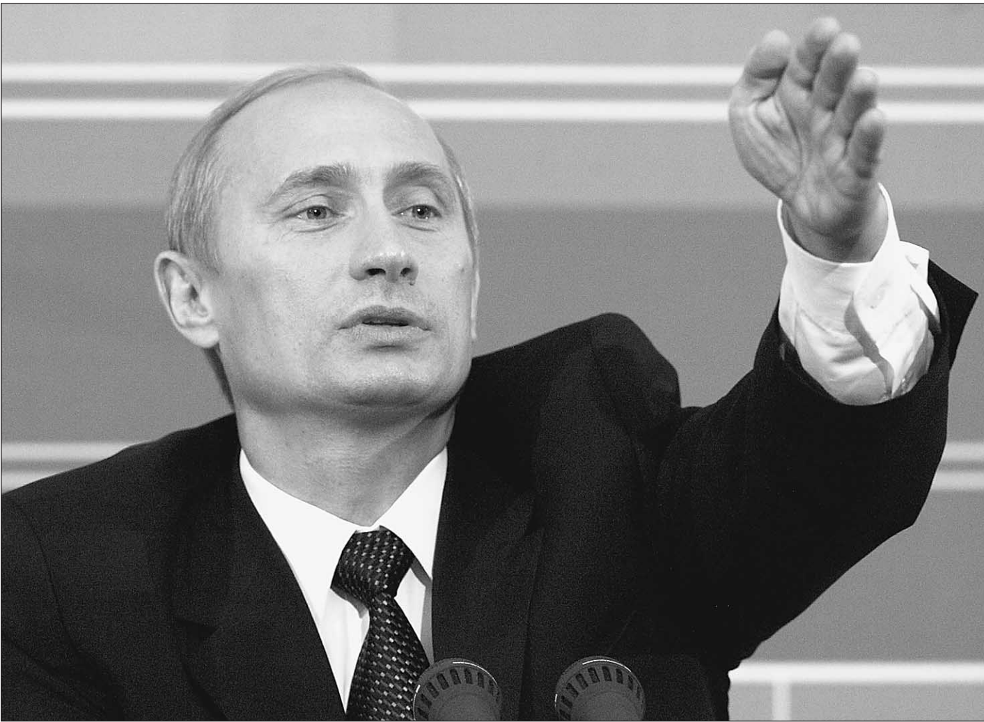
Верной дорогой идем

Было бы странно упрекать организаторов в том, что они тщательно подготовили мероприятие и грамотно определили тематику вопросов. Сначала — внутренние дела: Чечня, Калининград, собственная экономика, оборот земель, регионы-доноры. «Преимущество» на этом поле было у регио-