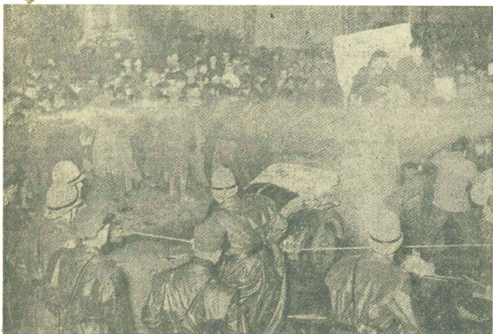
Столкновение антикоммунистических демонстрантов с полицией у советского посольства в Берне. Полиция пустила дымовую завесу