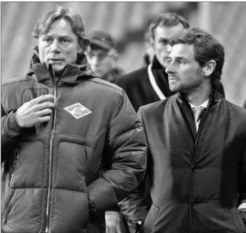
14 апреля 2011 года. Москва. Лужники. Лига Европы. 1/4 финала. Ответный матч. «Спартак» - «Порту» - 2:5. Болельщики из Петербурга должны принять Андре ВИЛЛАШ-БОАША с распростирытыми объятиями хотя бы за этот результат против команды Валерия КАРПИНА.

Другие парируют: он, конечно, максималист, но разве это плохо? Прежде не всегда учитывал возможности игроков, однако все течет, все меняется, в том числе и взгляды португальца. Стал ли Виллаш-Боаш более гибким? Скоро у нас будет возможность это проверить. Ясно одно: с этим тренером скучно не будет. А что еще нужно болельщикам?