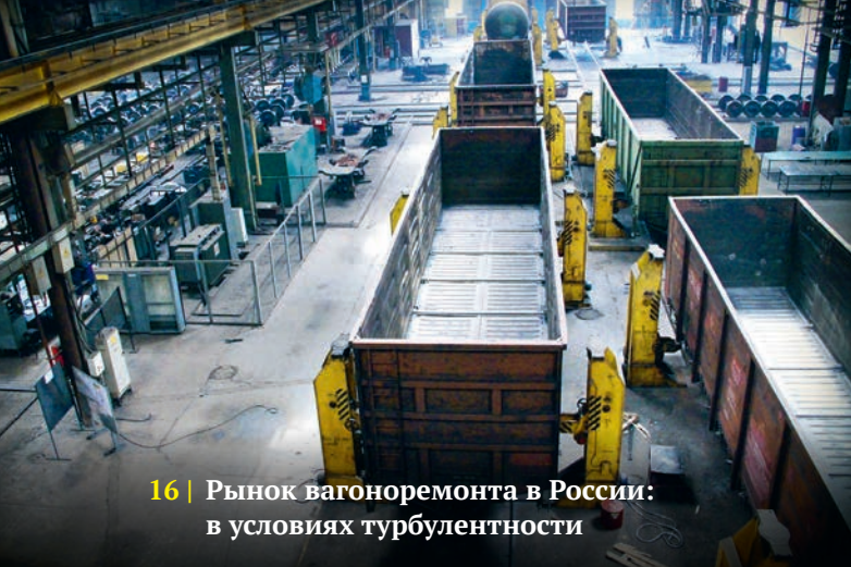
16 | Рынок вагоноремонта в России: в условиях турбулентности