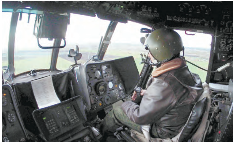
В первый год службы пилот должен налетать не менее ста часов

Готовят молодых лейтенантов к выполнению десантно-транспортных, разведывательных и боевых задач опытные лётчики-инструкторы. Очередное такое занятие прошло на минувшей неделе. В ходе тренировки экипажи много-