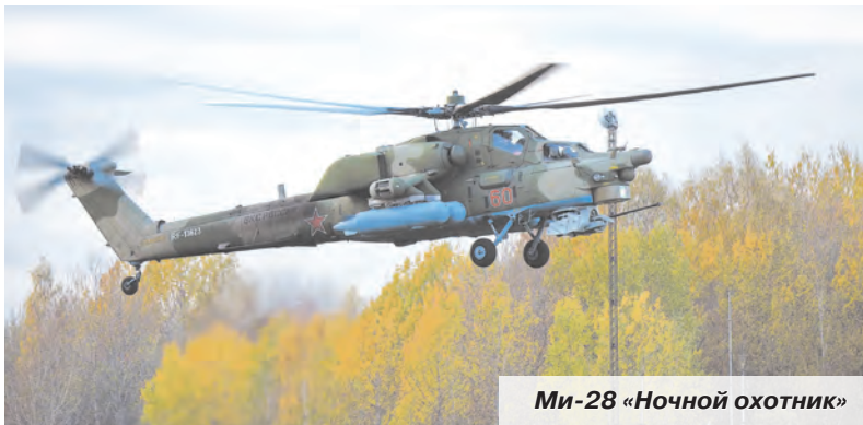
Ми-28 «Ночной охотник»

или берег реки, командир вертолёта должен сверху оценить параметры площадки для приземления, прикинуть вес вертолёта, температуру воздуха за его бортом, скорость ветра, высоту площадки над уровнем моря, а уж после этого решать – приземляться или нет. В боевой обстановке такие решения придётся принимать быстро, если возникнет необходимость высадить десант, эвакуировать раненых или доставить боеприпасы, грузы. Как заверили лётчики-инструкторы, тренировка прошла без сбоев. Справились все.