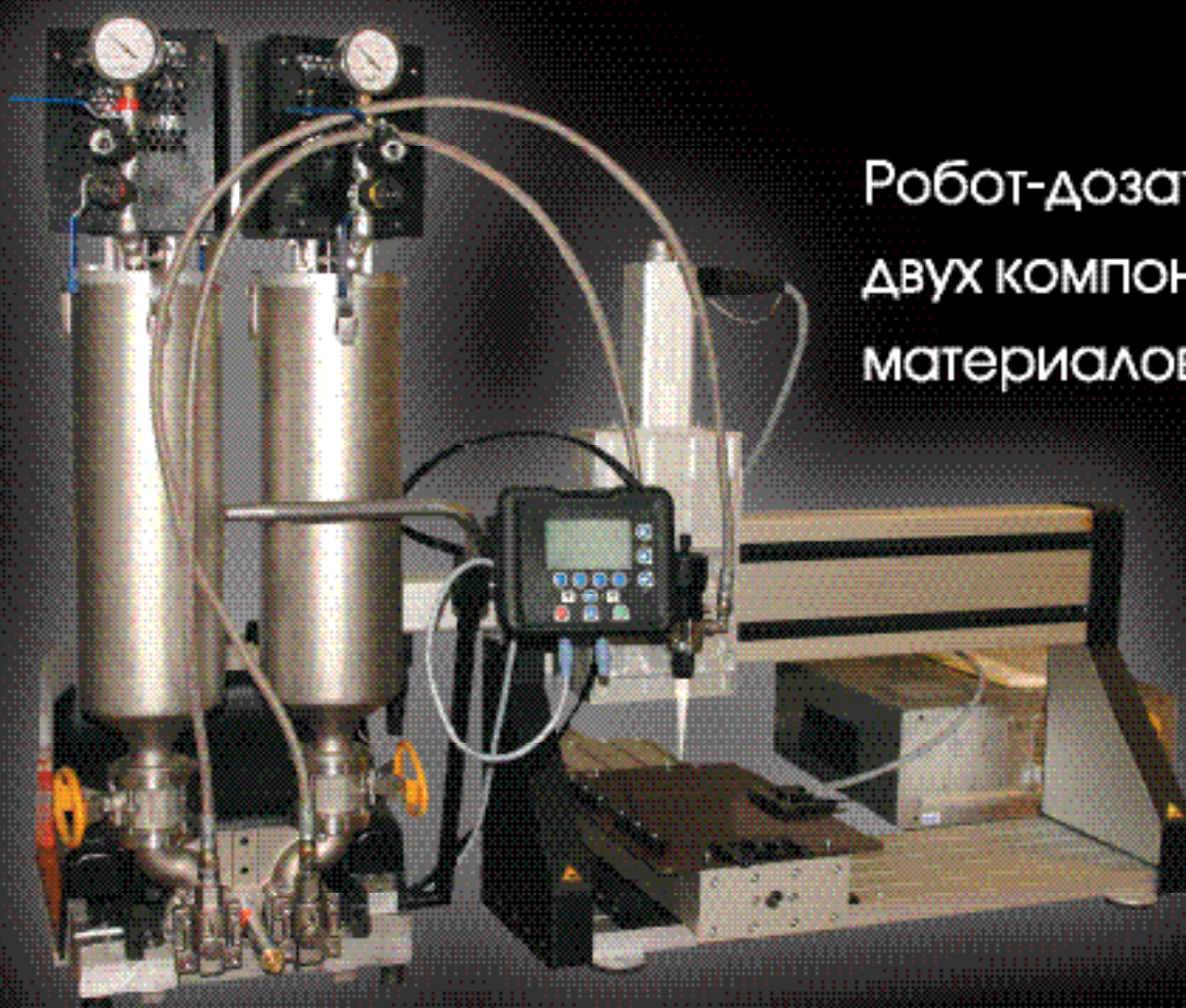
Робот-дозатор двух компонентных материалов