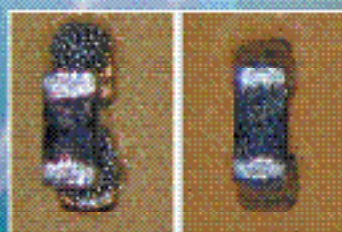
«Бессвинцовые» автоматы установки компонентов