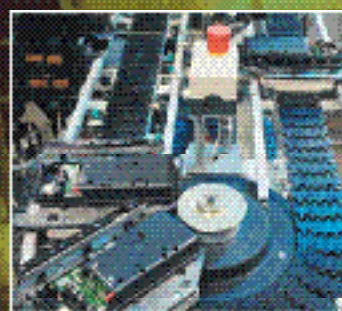
Производственная логистика FlexLink