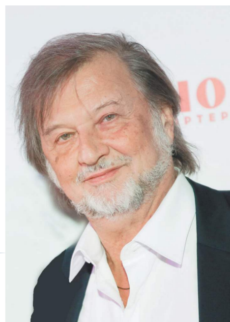
АЛЕКСЕЮ РЫБНИКОВУ — 80!

Шесть ярких моментов из жизни композитора