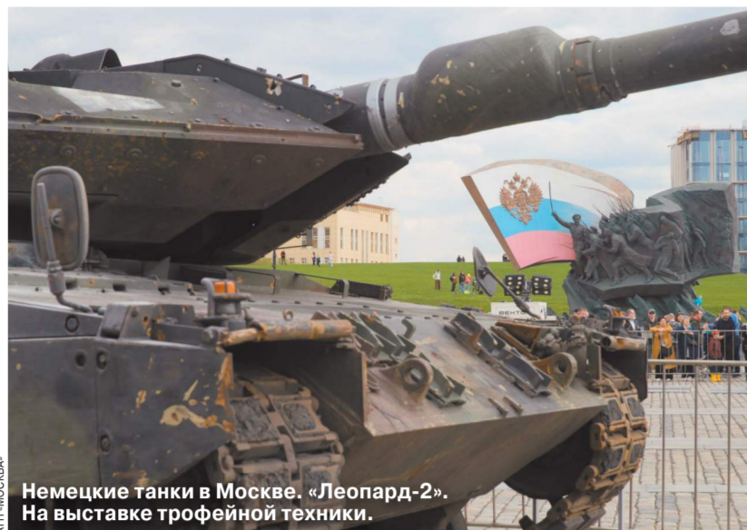
Немецкие танки в Москве. «Леопард-2». На выставке трофейной техники.