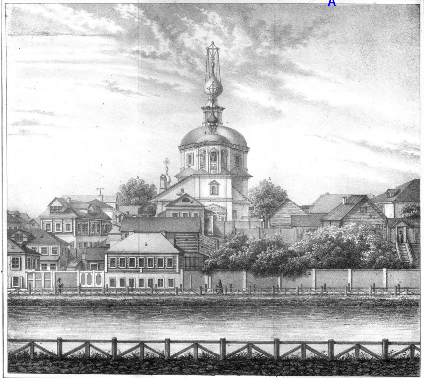
Гравит С. Павловъ