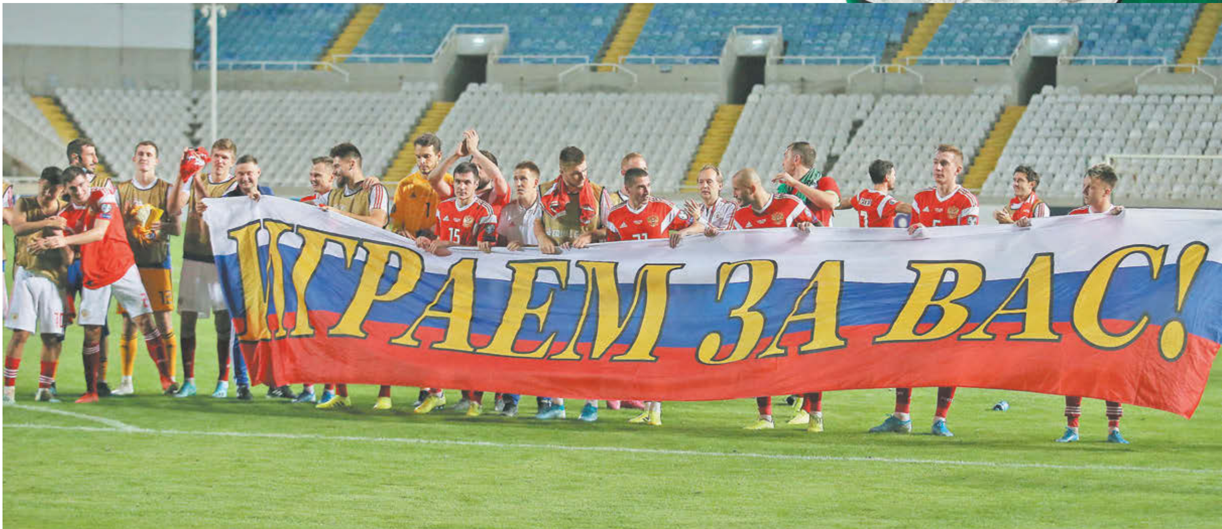
Вчера. Никосия. Кипр – Россия – 0:5. Наша сборная после игры благодарит болельщиков за поддержку