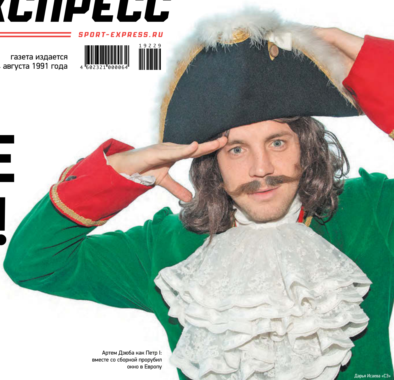
Артем Дзюба как Петр I: вместе со сборной прорубил окно в Европу

Сборная России уничтожила Кипр (5:0) и вышла на Евро-2020!