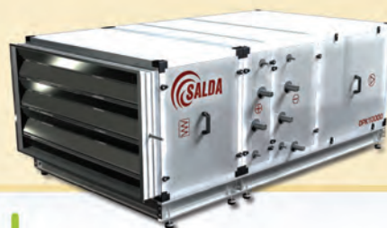
Каркасно-панельные вентиляционные установки