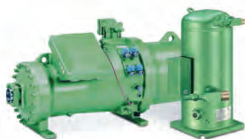
спиральные и винтовые компрессоры Bitzer