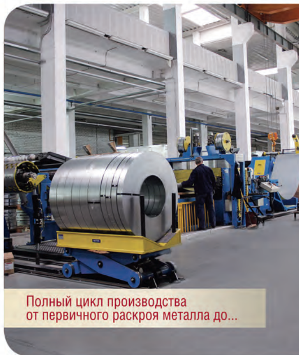
Полный цикл производства от первичного раскроя металла до...