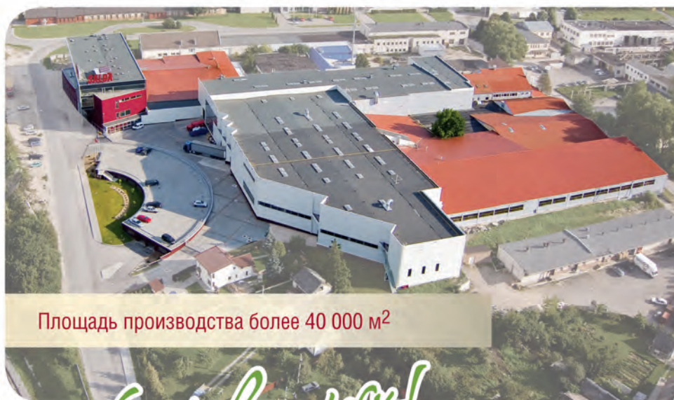
Площадь производства более 40 000 м 2