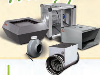
Вентиляторы различных типов, сетевые элементы и каналные нагреватели