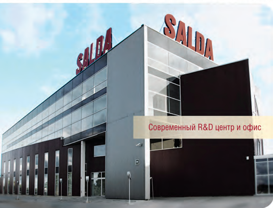
Современный R&D центр и офис