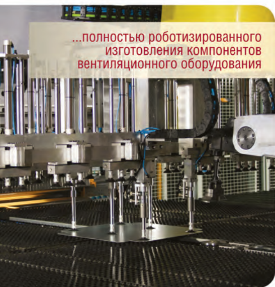
...полностью роботизированного изготовления компонентов вентиляционного оборудования