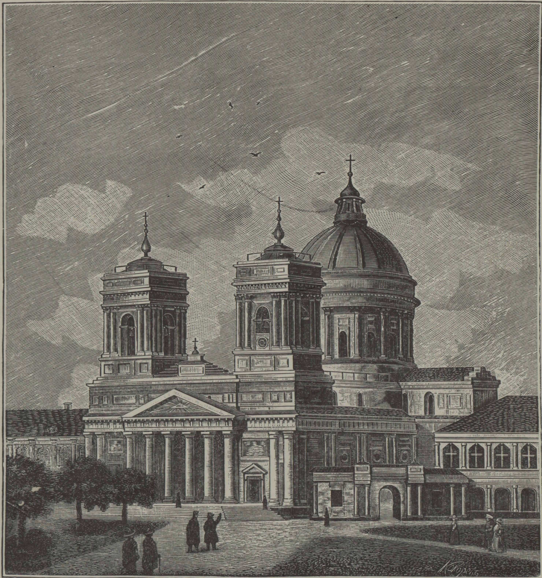
СОБОРНЫЙ ХРАМЪ Александрo-Невской Лавры.