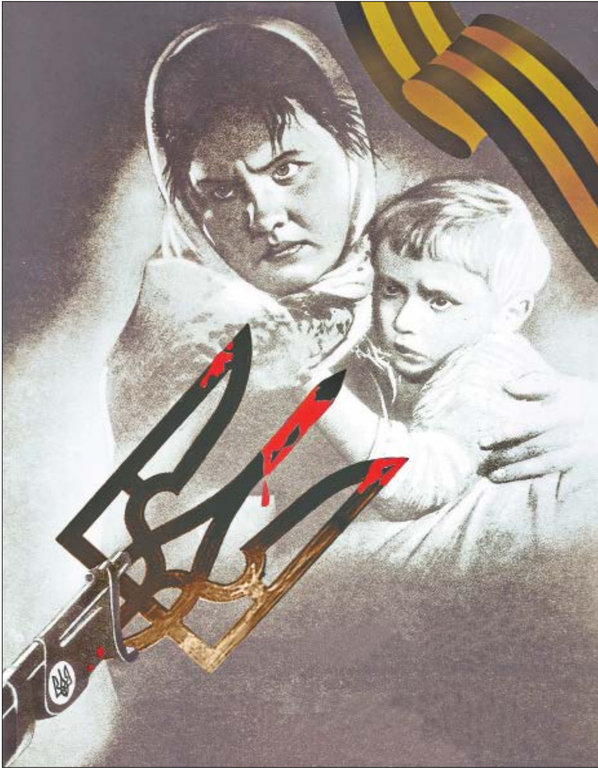
В коллаже использован плакат В. Корешкова «Фронт Красной армии» – старый – 1942 г.

Понятно, что аудитории бы- ли удостоены избранные. И всё же... Трупы ни в чём не повинных детей, женщин на улицах обстре-