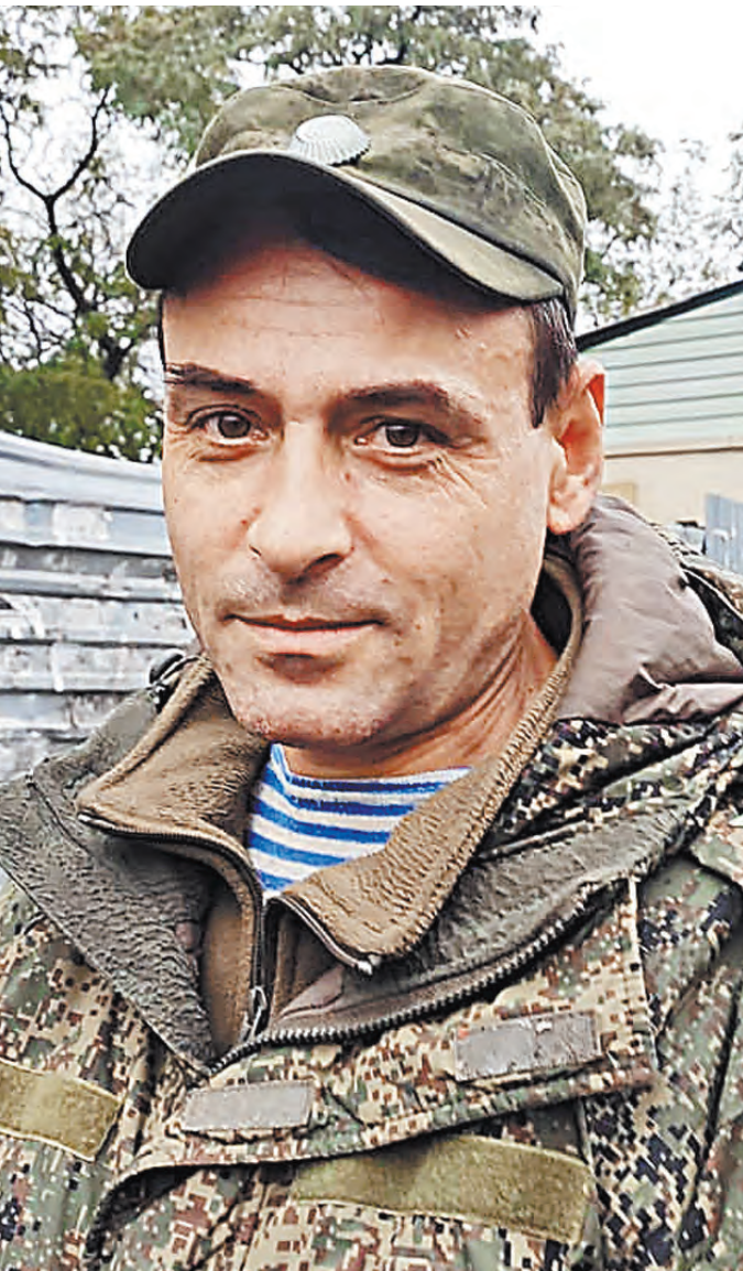
«Кадет»: На фронте обязательно должно быть то, о чем ты молчишь.