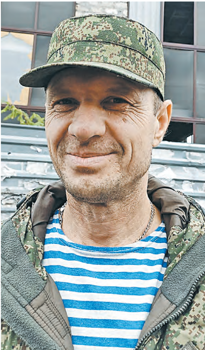
«Каскадер»: Я жду дня Победы — скорее бы!